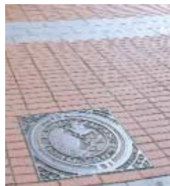
Saneringen af Rendebanen (øverste billede) mellem Søndergade og Bredgade i 2003 har skabt en ny plads i byen. Nederst eksempler på gadeudstyr m.v. installeret i forbindelse med etablering af ny belægning i Koldings gågader fra 2000. Belægningen er udført af landskabsarkitekt Sven Ingvar Andersson.