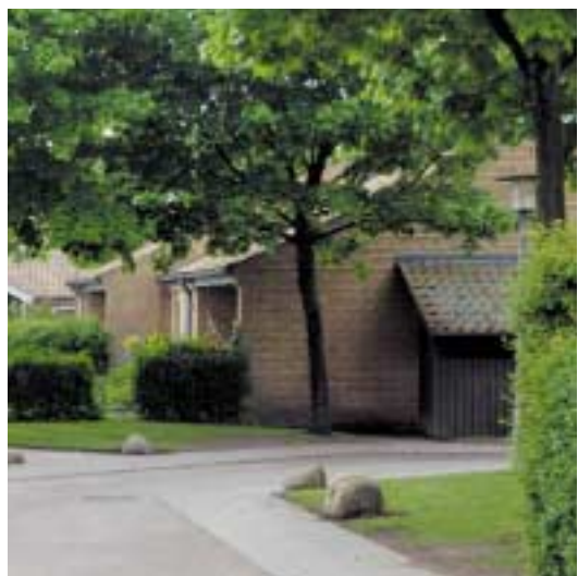
Pinjeparken er et eksempel på et vellykket tæt/lavt, støttet byggeri. Opført 1984.

Bygningsvolumen og bygningshøjde har stor indflydelse på, om et byggeri fremtræder harmonisk i samspil med de omliggende byggerier. Overordnet set har der ikke været tradition for at bygge højt i Kolding. Fra gammel tid er det kirkerne og Koldinghus på sin Slotsbanke, der hæver sig over middelalder-