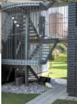
Nutidig arkitektur i historiske omgivelser kan skabe gode oplevelser som her Kolding Byferies punkthuse i samspil med Slotsøen og Koldinghus.