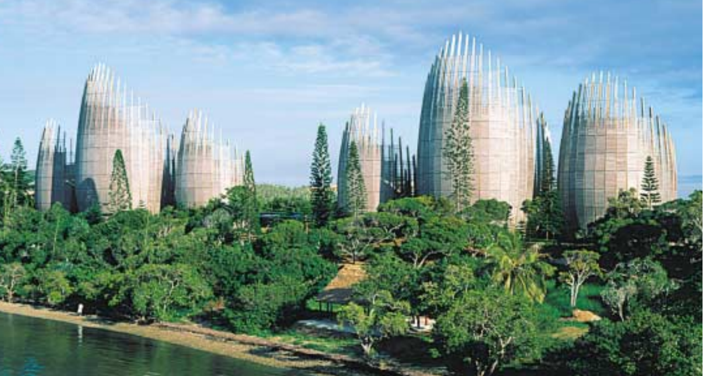
Eksempel på kombination af lokale materialer, konstruktionsmetoder og moderne teknologi. Kulturcenter Nouméa, Ny Caledonien, arkitekt Renzo Piano.