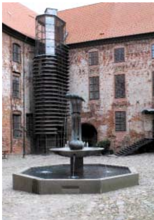
Restaureringen af Koldinghus viser, hvor vigtig den gode detalje er for det gennemførte helhedsindtryk.

Arkitekturpolitikken skal være et fælles redskab, når vi udvikler Kolding Kommune.