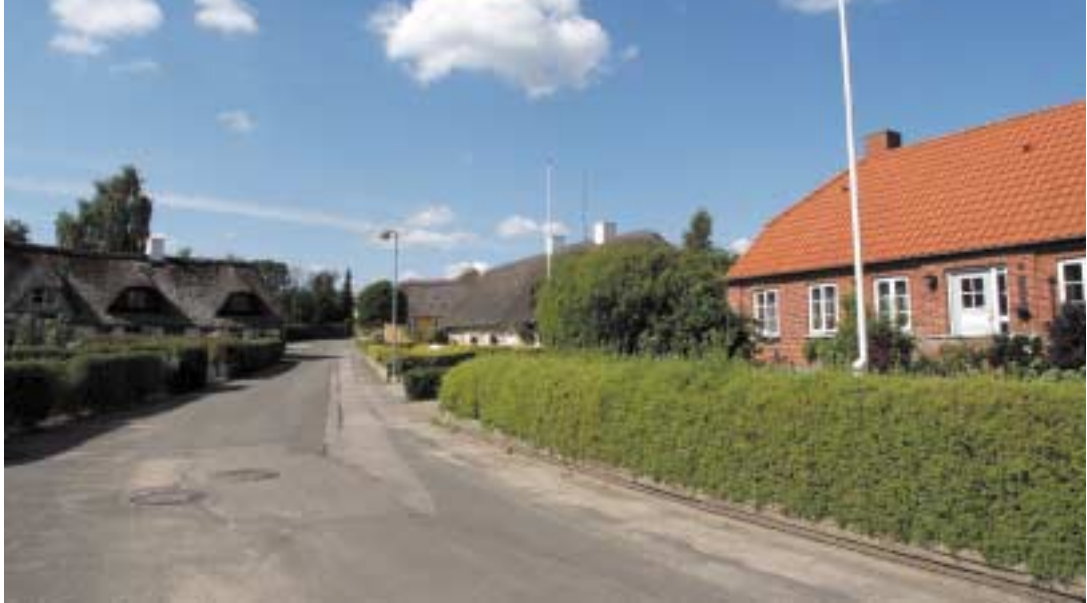
Gamle huse i landsbyerne er stemningsfulde elementer i det landlige bybillede – her Stenholt i Sdr. Stenderup.