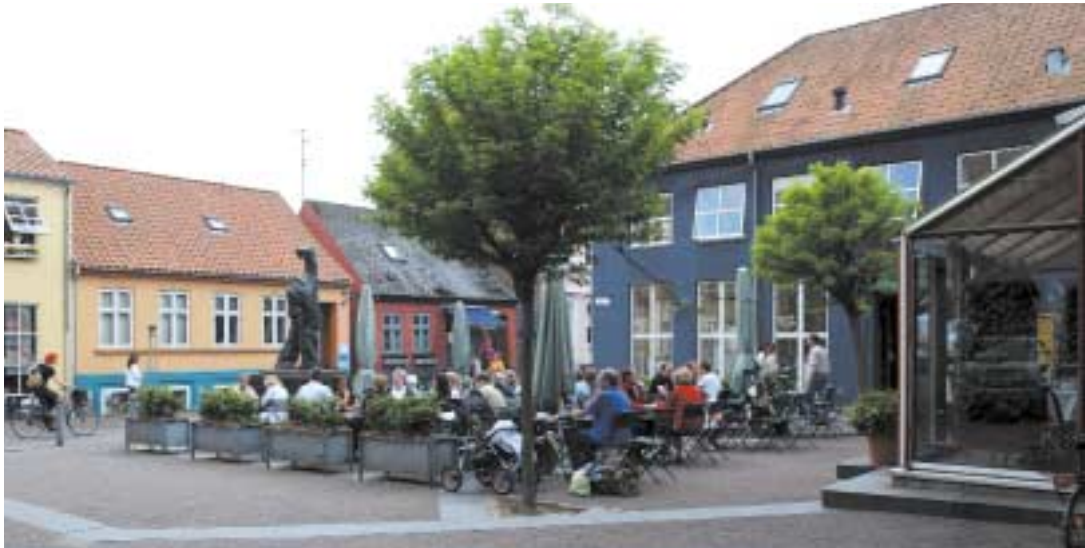
Lille Torv er et eksempel på en ny plads i byen skabt gennem ombygning og udflytning af industri.