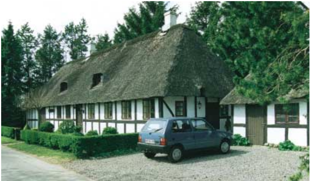
Øverst: Ved Møllevang mellem Kolding og Hjarup ligger et godt eksempel på et nyt enfamiliehus i det åbne land. Huset er brudt op i mindre enheder med traditionelle former og taghældning, men udført i lette materialer, så de ikke syner voldsomt i landskabet.