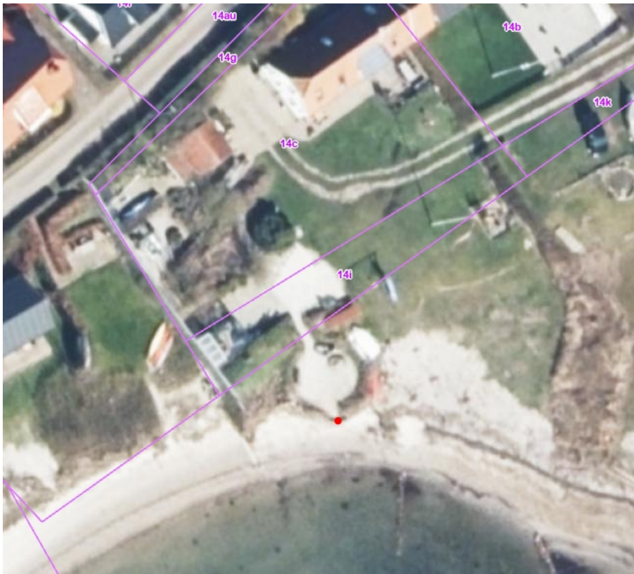
Figur 1. Ortofoto fra foråret 2023 med matrikelgrænser indtegnet. Den røde prik indikerer murens ydre grænse mod stranden.