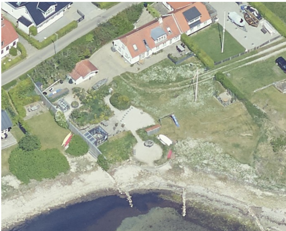
Figur 2. Skråfoto, hvor murens placering ses helt ud til stranden. Skråfotoet er taget den 20. maj 2023 (Skråfoto, Styrelsen for Dataforsyning og Infrastruktur).