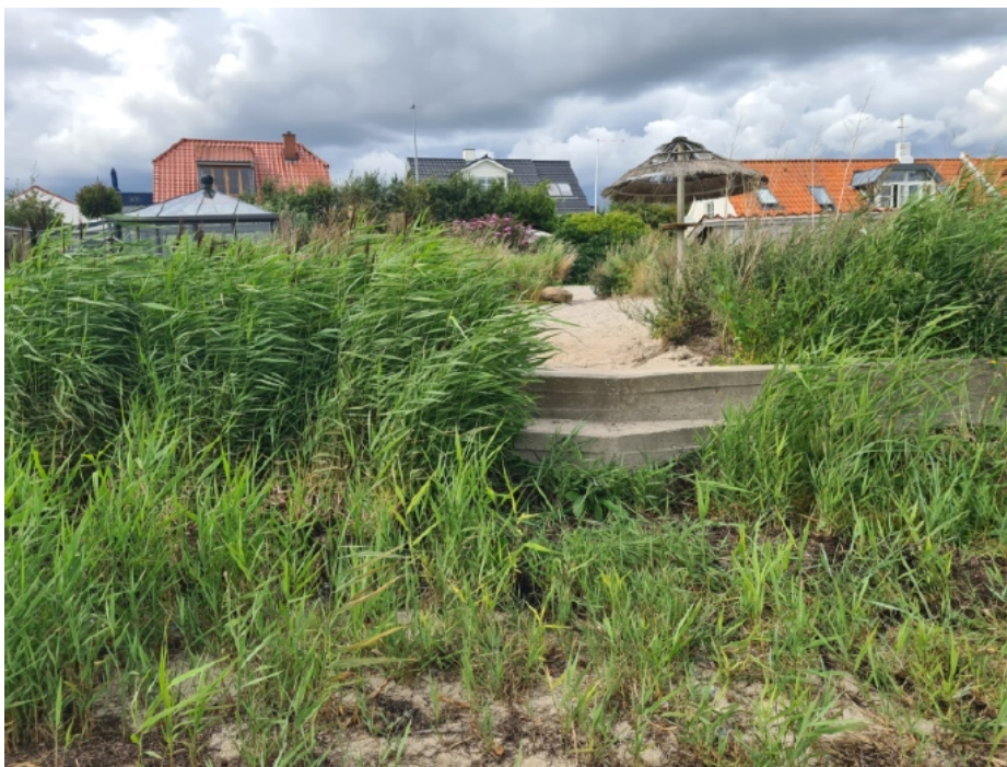
Figur 3. Billede af mur med indbygget trappe (fra ansøgningsmateriale). På billedet dækker vegetationen for en stor del af muren.