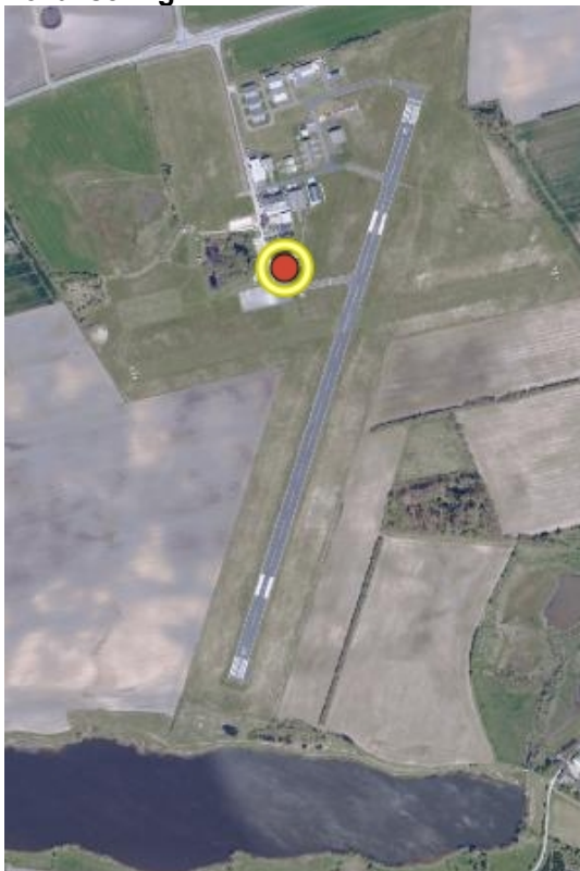
Figur 1 Oversigtskort over Kolding Lufthavn