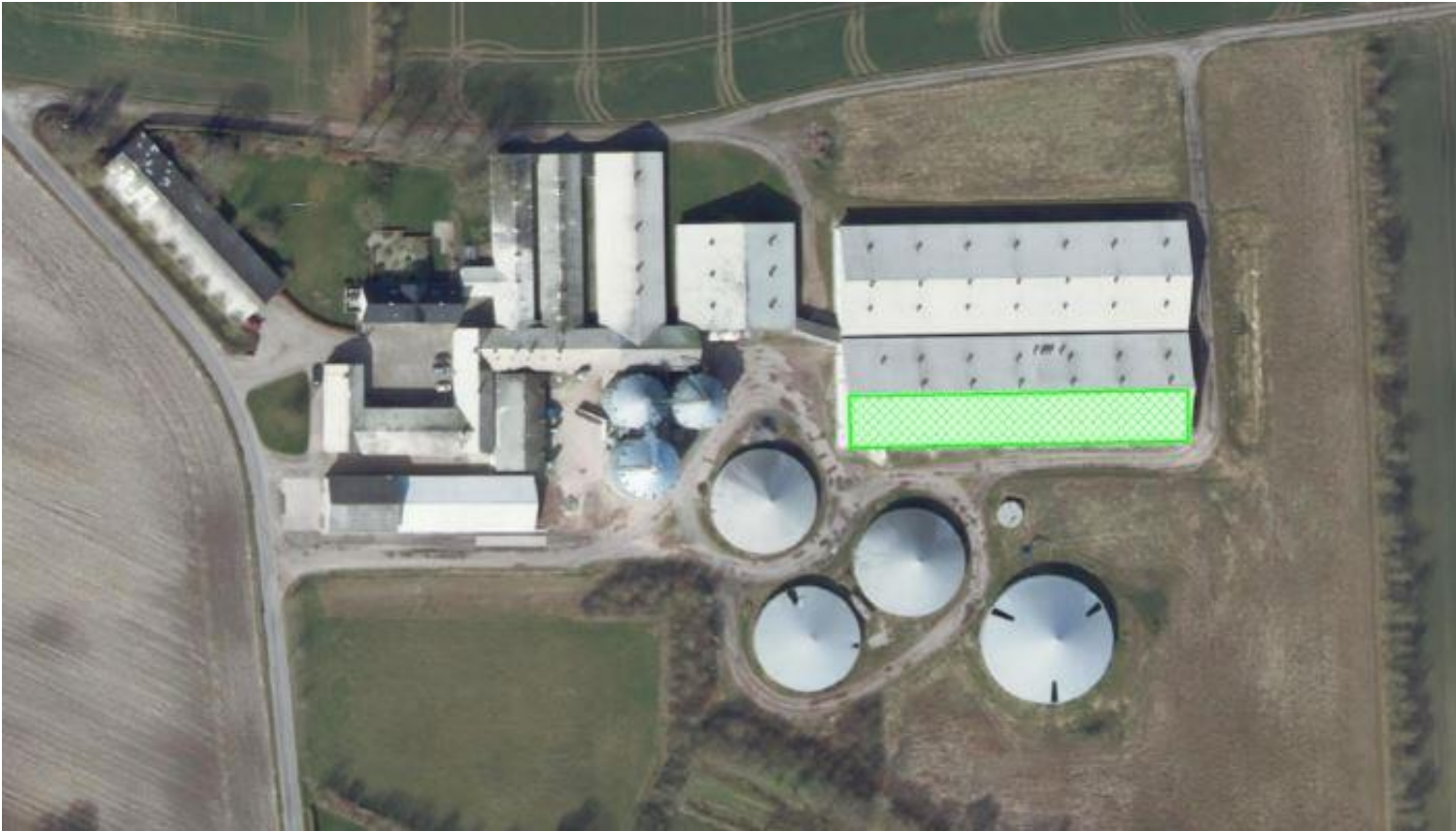
Kort 2: Situationstegning