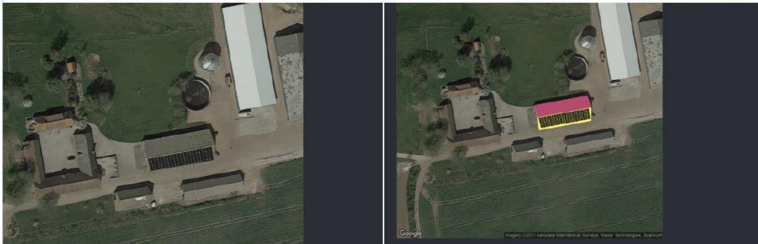
Kort 2: Situationstegning