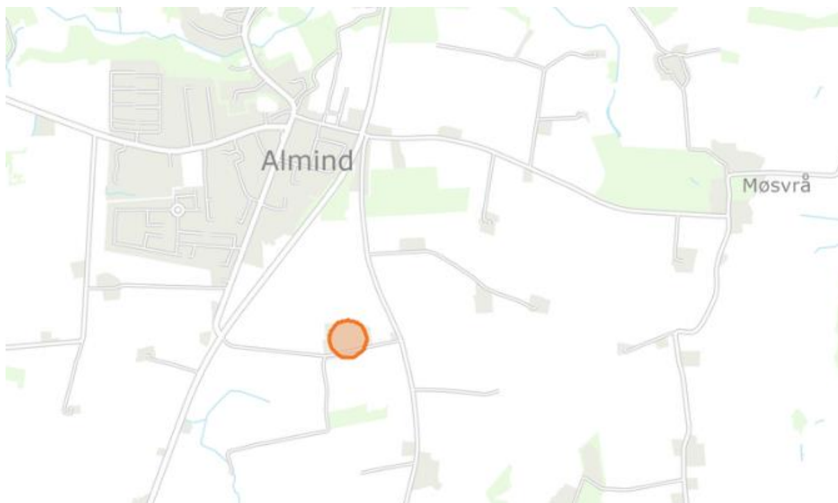
Kort 1. Ejendommen Gl. Landevej 60 er markeret med rød cirkel.

Kolding Kommune har modtaget en ansøgning om etablering af et 30 kW solcelleanlæg på tagfladen af en eksisterende driftsbygning på en landbrugsejendom. Projektets arbejder udføres på matrikel nr. 11a Almind By, Almind, og monteringen sker på bygning 10 (jf. BBR) på ejendommen Gl. Landevej 60, 6051 Almind (se kort 1+2). Solcellerne monteres på taget med skinner og specielle beslag, som fastgøres til spær.