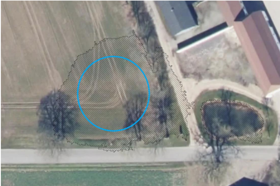
2. Arealet hvor sø 1 ønskes etableret, udgør en lavning i terrænet (sort skravering). Søens placering er groft markeret med en blå cirkel.