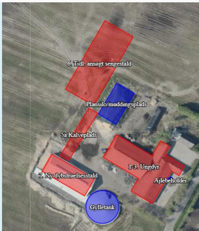
Figur 1. Oversigt over anlæg på Tøndervej 50, Vamdrup