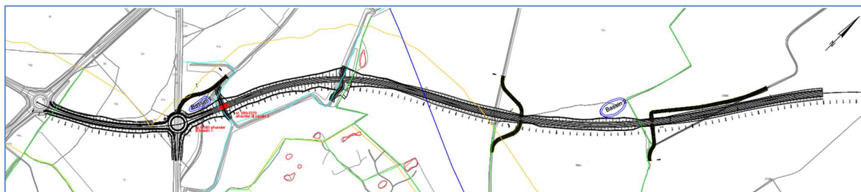
Figur 2: Udsnit af tegning T_AFV_901, der angiver placeringer af bassin 1 og 2.