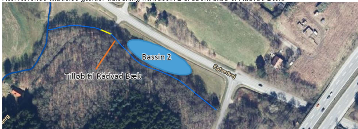
Figur 2: Angivelse af omtrentlig placering af bassin 2.

Nærværende tilladelse gælder udledning fra bassin 2 til åbent tilløb til Rådvad Bæk.