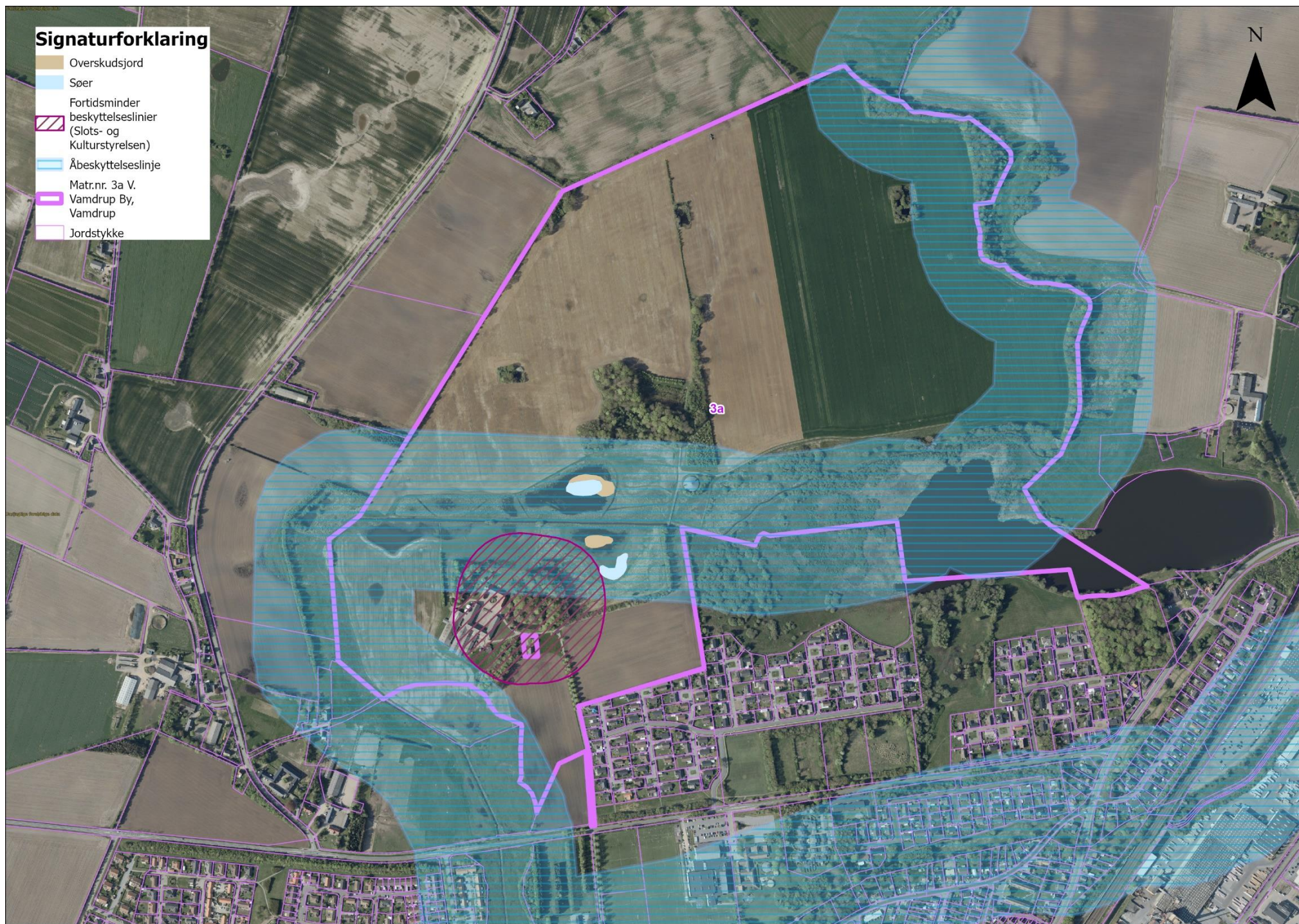
Kortbilag 2. Oversigts over matriklen