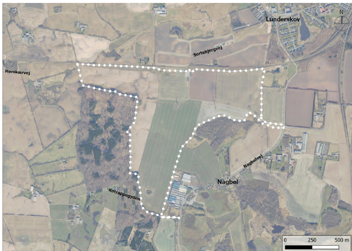
Luftfoto med afgrænsningen af lokalplanområdet og området for kommuneplantillægget.

Byrådet har den 24. september 2024 vedtaget at fremlægge forslag til Tillæg 45 til Kommuneplan 2021-2033 og forslag til Lokalplan 1119-81 Solceller ved Nagbøl. Offentliggørelse af planforslagene og miljøvurderingsrapporten samt det tilhørende udkast til § 25-tilladelse sker efter planlovens §§ 24-26 og miljøvurderingslovens § 32 og § 35.