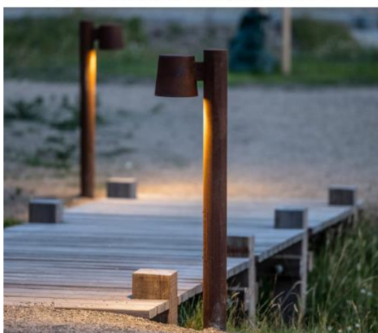
Eksempel på belysning, jf. ansøgning. Lav højde på armatur, varmt, retningsbestemt lys, max farvetemperatur på 3000 K.