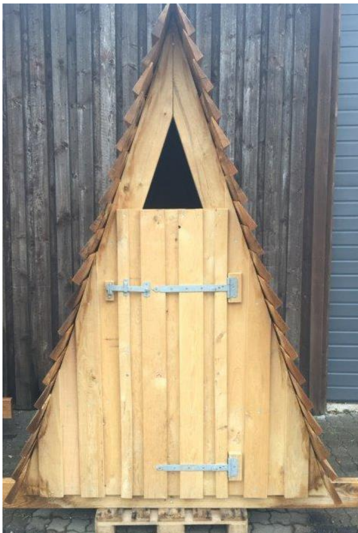
Foto af muldtoilet, jf. ansøgningen

Ejendommen har en samlet størrelse på 353 ha og er ikke omfattet af landbrugspligt.