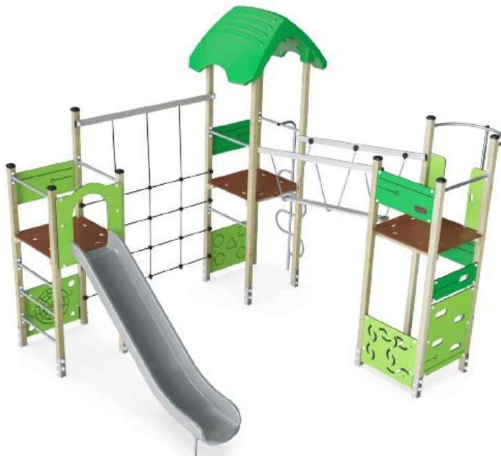
Illustration af legetårn, jf. ansøgningen

Situationsplan med placering af legetårnet nordligst, svævebanen mod vest. Et gyngestativ syd for legetårnet og et gyngestativ mod øst, jf. ansøgningen