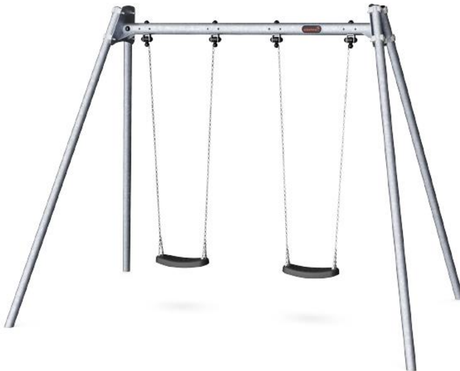
Illustration af gyngestativ, jf. ansøgningen

Ejendommen har en samlet størrelse på 3,1 ha og er ikke omfattet af landbrugspligt.