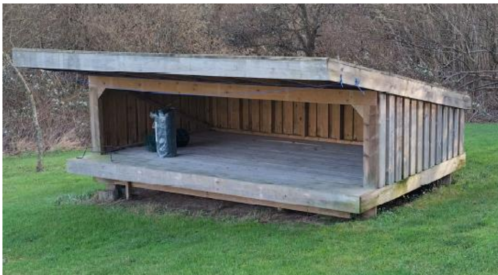
Foto af facade, jf. ansøgningen

Ejendommen har en samlet størrelse på 0,5 ha og er ikke omfattet af landbrugspligt.