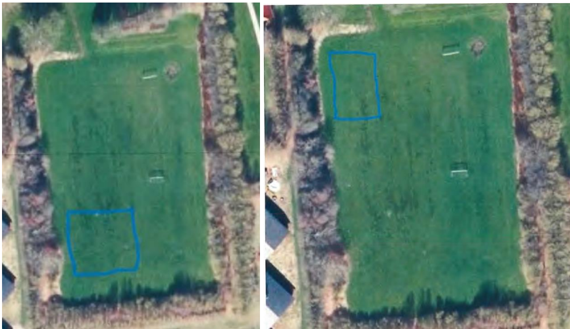
Situationsplan med placering til legeredskaberne sydligst og kælkebakken nordligst, jf. ansøgningen

Ejendommen har en samlet størrelse på ca. 0,9 ha og er ikke omfattet af landbrugspligt.