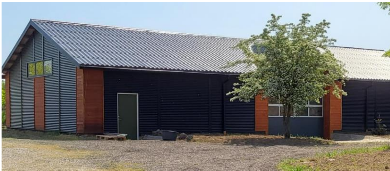
Inspirationsbillede i forhold til facaden jf. ansøgningen

Ejendommen har en samlet størrelse på 1,1 ha og er ikke omfattet af landbrugspligt.