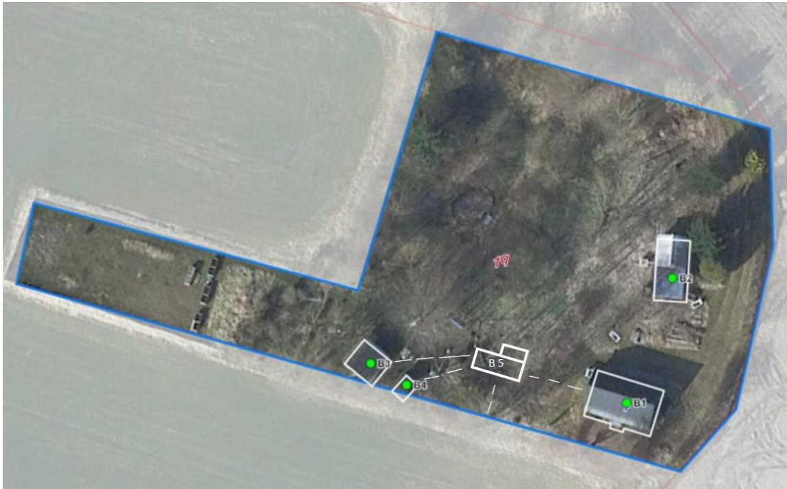
Luftfoto med angivelse af bålhytten (B5), jf. ansøgningen