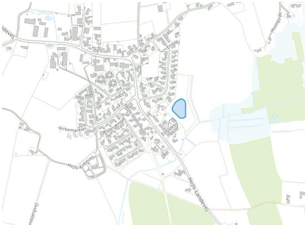
Kortbilag 1. Placering af regnvandsbassin er markeret med blå polygon.