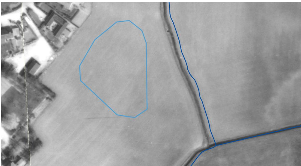
Kortbilag 4. Luffoto 1984. Placering af regnvandsbassin er markeret med blå polygon. Arealet er opdyrket.