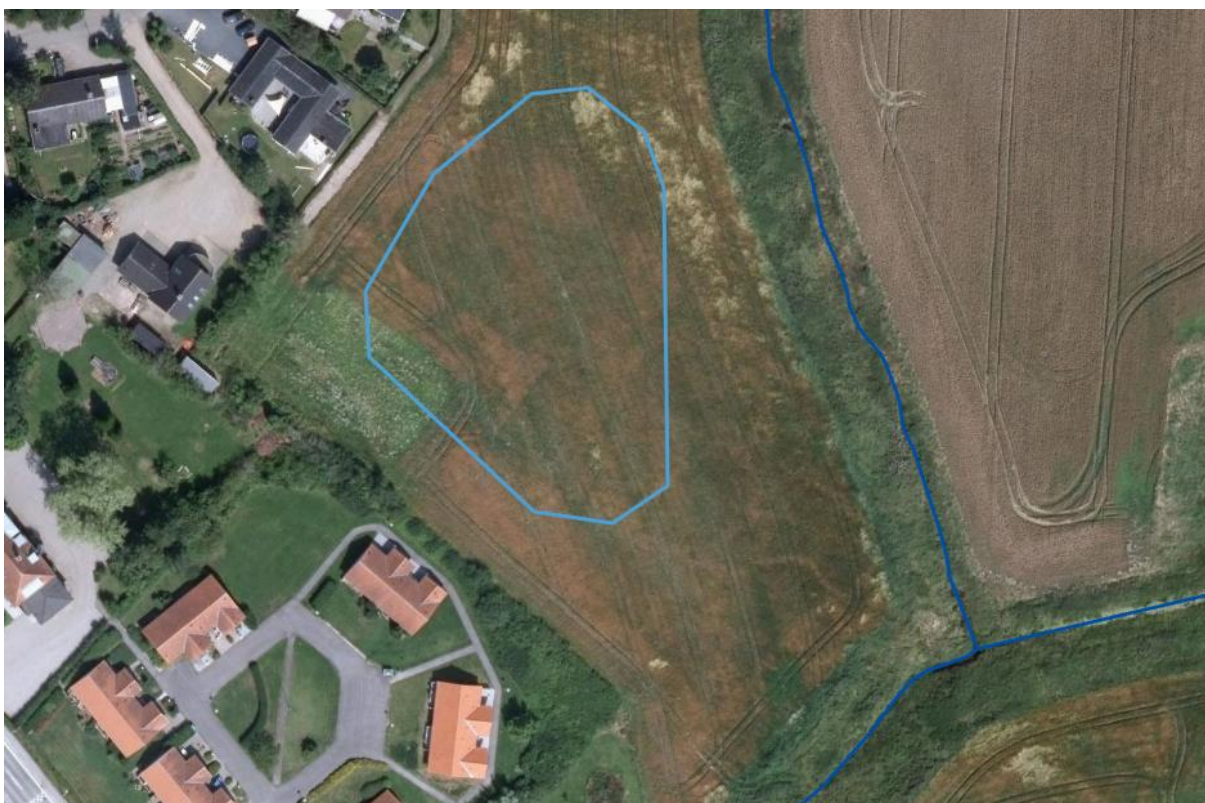
Kortbilag 6. Luftfoto sommer 2014. Placering af regnvandsbassin er markeret med blå polygon. Sidste år, hvor arealet er omlagt.