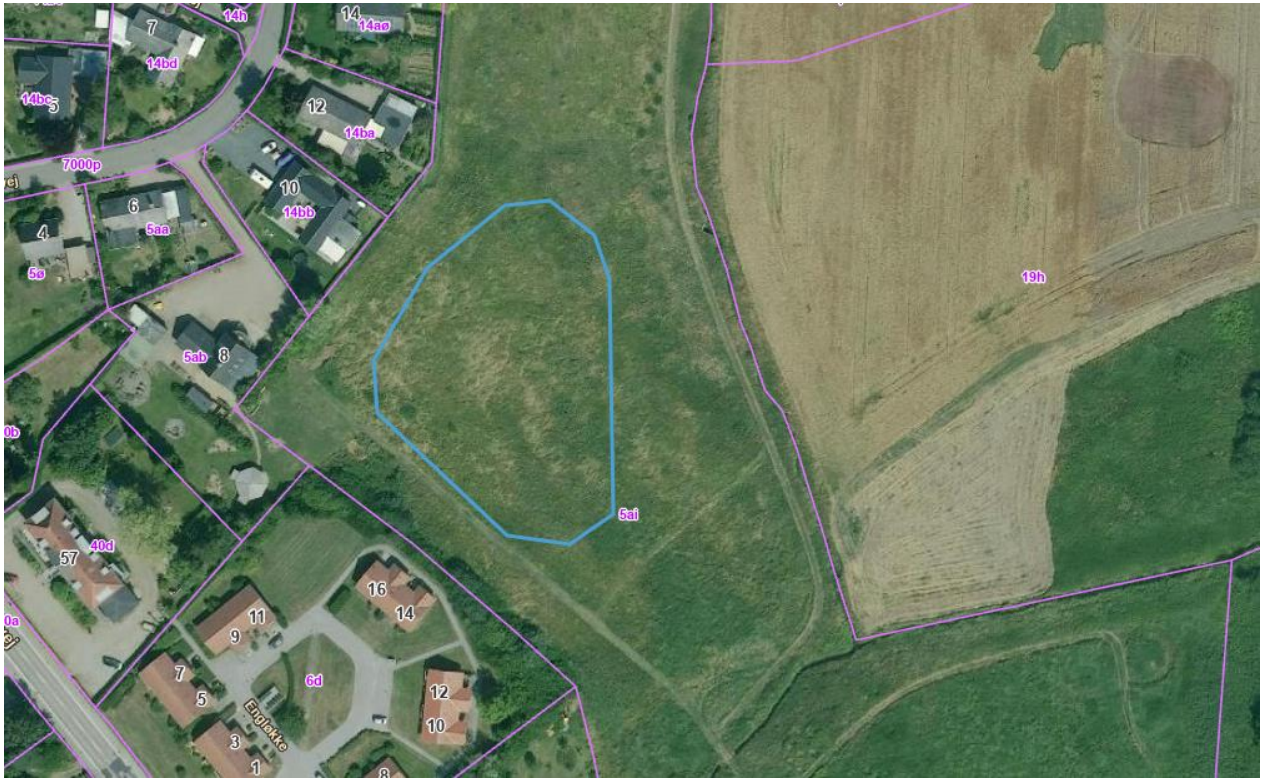
Kortbilag 7. Luftfoto sommer 2022. Placering af regnvandsbassin er markeret med blå polygon. Arealet er ikke opdyrket.