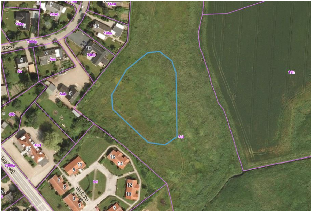
Kortbilag 5. Luftfoto sommer 2010. Placering af regnvandsbassin er markeret med blå polygon. Arealet er ikke opdyrket.