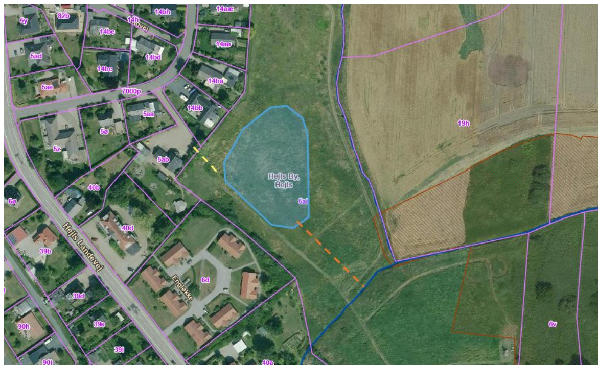
Kortbilag 2. Luftfoto sommer 2022. Markeret er: placering af regnvandsbassin (blå polygon), placering af overløb (orange, stiplede linje), placering af adgangsvej (gul, stiplede linje) § 3- beskyttet mose (rød skraveret) og vandløb (blå streg).