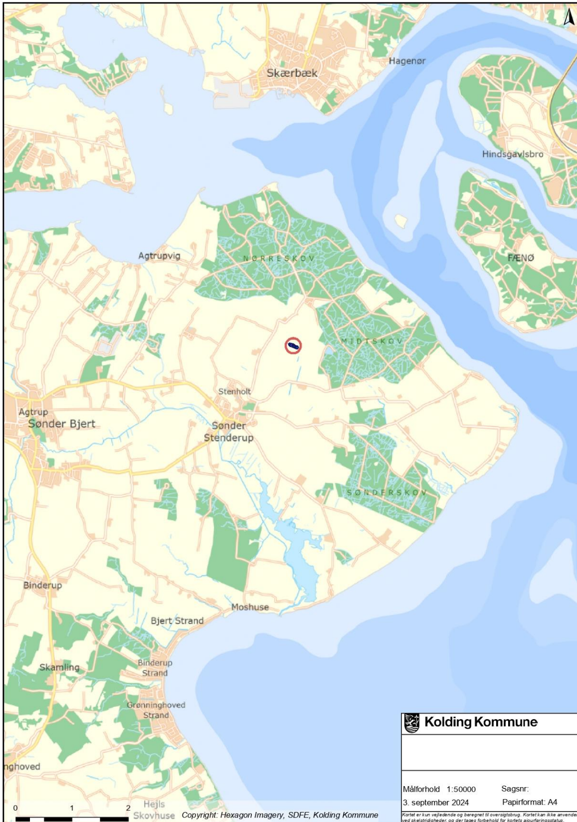
Kortbilag 1: Oversigtskort, der viser minivådområdets placering i kommunen.