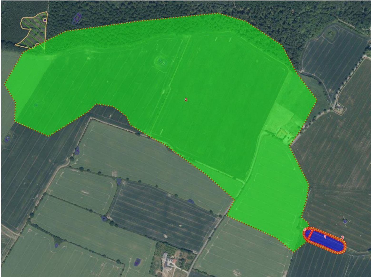
Kortbilag 3: Grøn polygon er drænoilandet, orange linje er projektområdet og blå polygon er minivådområdets vandspejl.