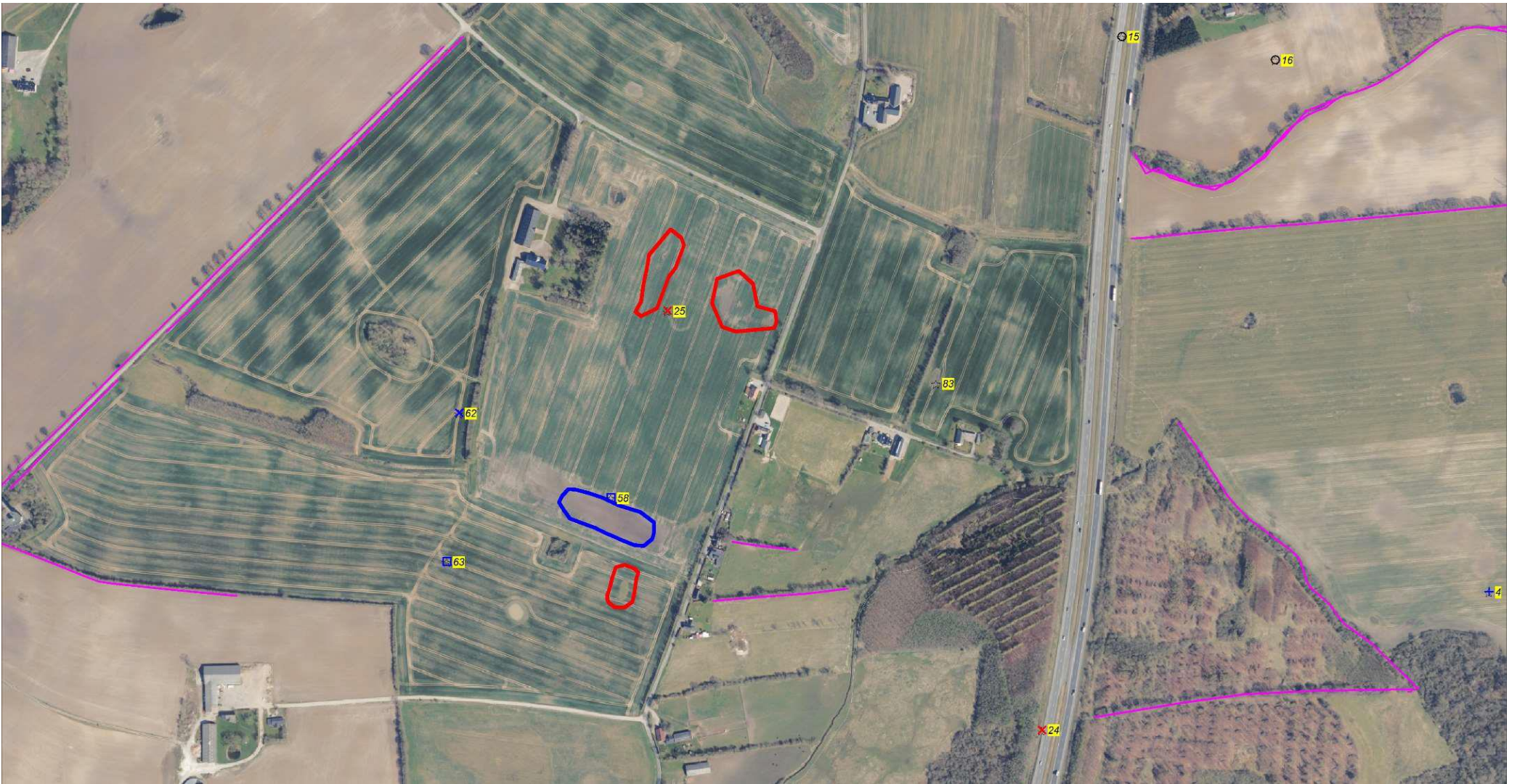
Kortbilag 4: Billedoversigt over ikke-fredede fortidsminder, som er markeret med tal på gul baggrund. Blå farve er der hvor minivådområdet skal placeres. Rød farve er tidligere områder, hvor overskudsjord skulle placeres, men som er blevet ændret til ny placering som i kortbilag 2. Museum Sønderjylland er blevet hørt vedrørende ændring af placering af overskudsjord. Lilla linjer er jorddiger.