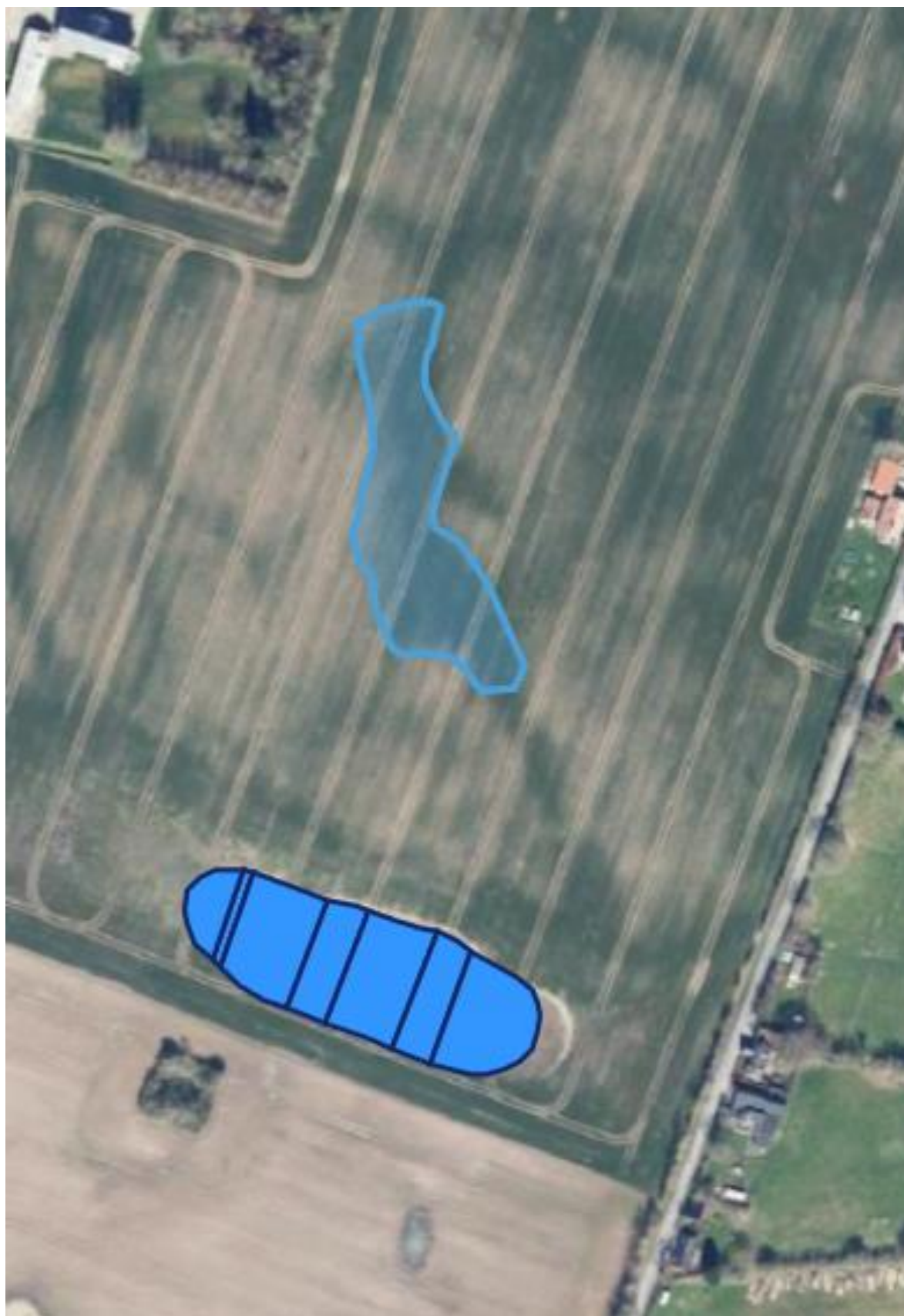
Kortbilag 2: Oversigtskort, der viser minivådområdets placering på matr.nr. 22b Lunderskov By, Skanderup. Overskudsjorden fra anlægsarbejdet spredes ud indenfor den blå polygon. Før udlægning afgraves muldjorden delvist (ca. 15 cm). Jorden lægges herefter ud i max 0,5 m. højde.