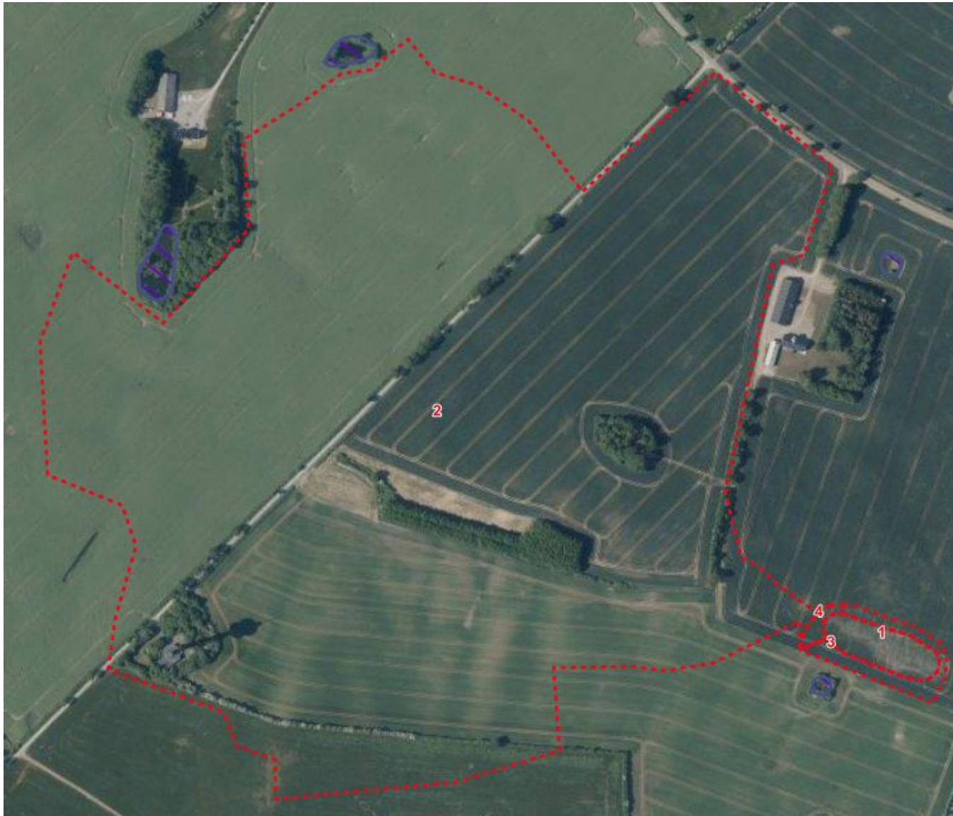
Kortbilag 3: Nr 2 er drænoilandet, nr. 1, 3 og 4 er minivådområdets vandspejl.