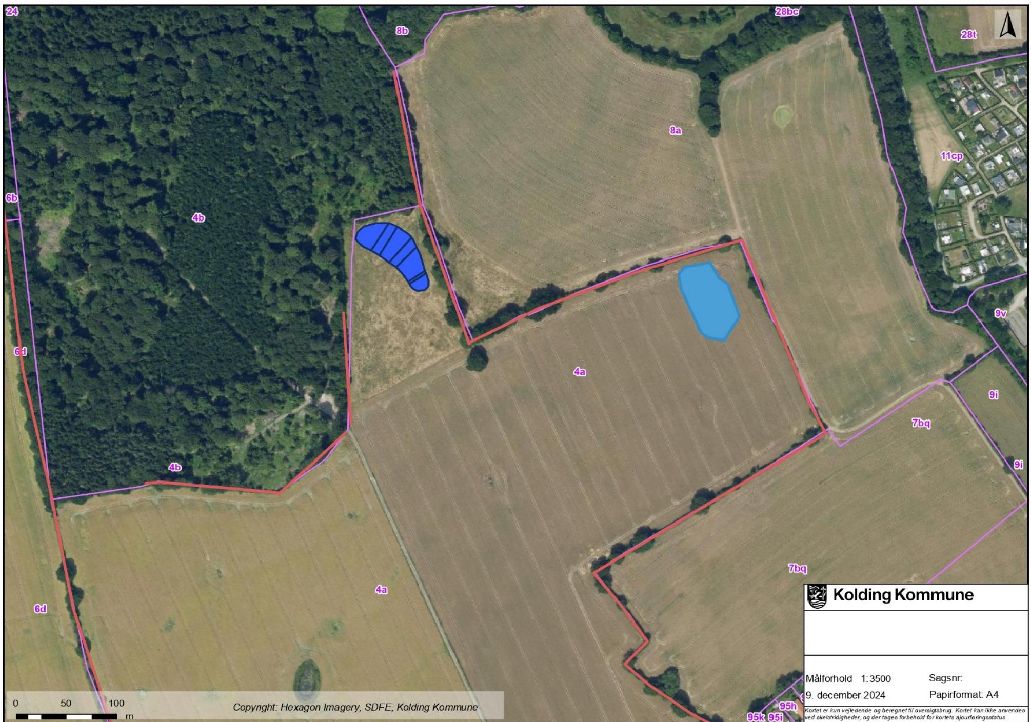
Kortbilag 2: Oversigtskort, der viser minivådområdets placering på matr.nr. 4a Vonsild By, Vonsild. Overskudsgrunden fra anlægsarbejdet spredes ud indenfor den gule linje. Før udlægning afgraves muldjorden delvist (ca. 15 cm). Jorden lægges herefter ud i max 0,5 m. højde. Der skal desuden holdes en afstand på 10 til det beskyttede jorddige og diget må ikke beskadiges under anlægsarbejdet.