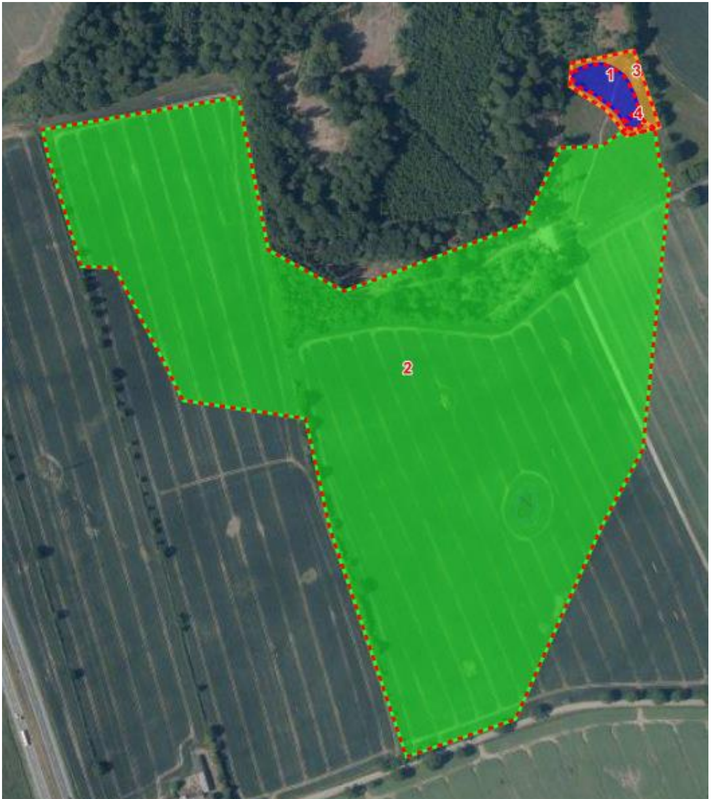
Kortbilag 3: Grøn er drænoplandet, orange projektområdet og blå minivådområdets vandspejl.