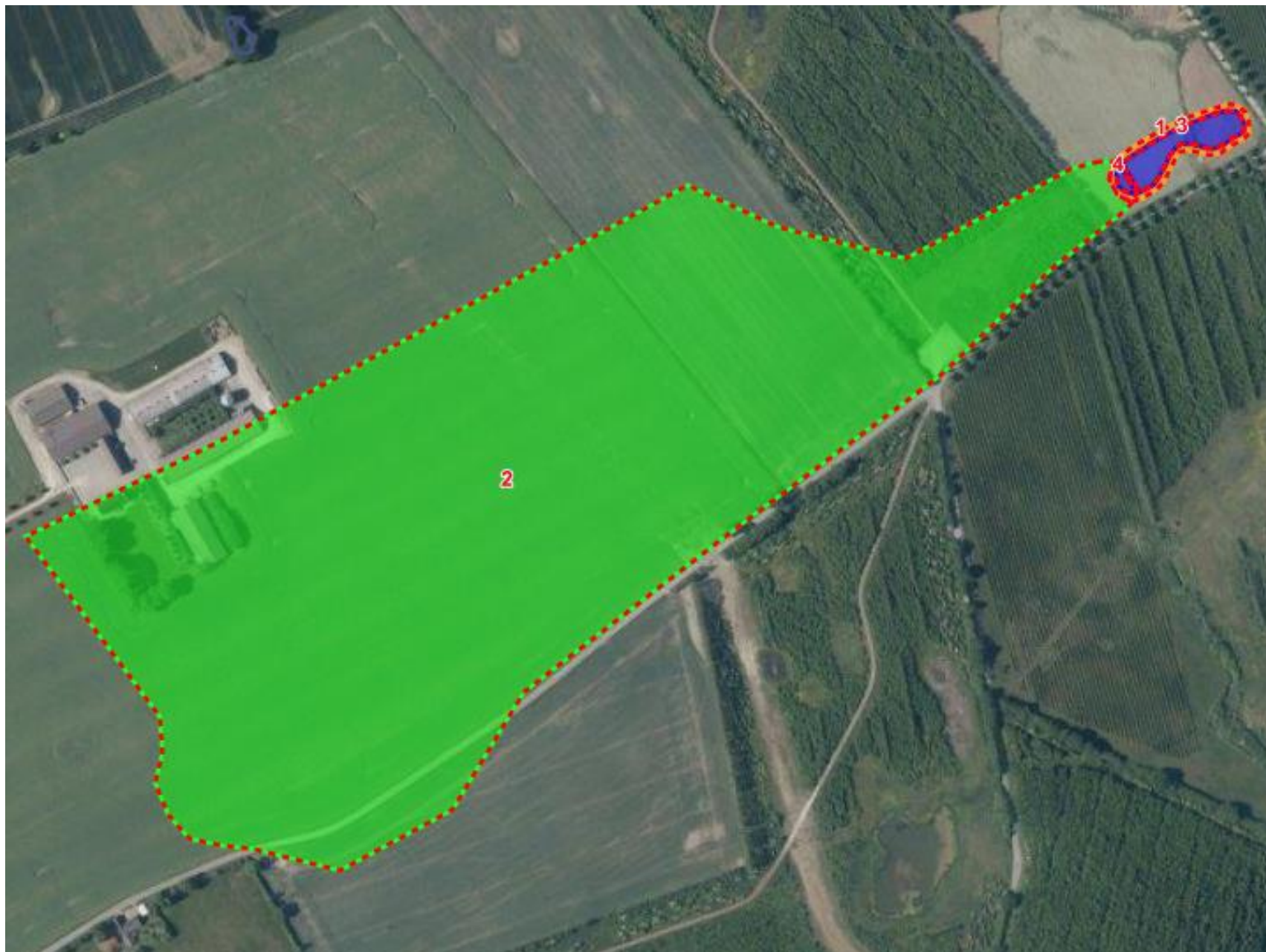
Kortbilag 3: Grøn er drænoplanet, orange projektområdet og blå minivådområdets vandspejl.