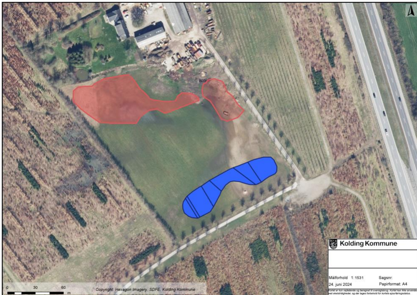
Kortbilag 2: Oversigtskort, der viser minivådområdets placering på matr.nr. 21e Vonsild By, Vonsild. Overskudsjoeden fra anlægsarbejdet spredes ud indenfor den røde linje. Før udlægning afgraves muldjorden delvist (ca. 15 cm). Jorden lægges herefter ud i max 0,5 m. højde.