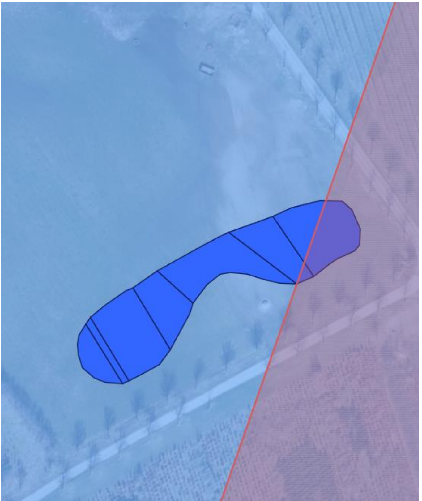
Kortbilag 4: Blå polygon er det planlagte minivådområde. Rød polygon er udpeget som nitratfølsomt indvindingsopland.