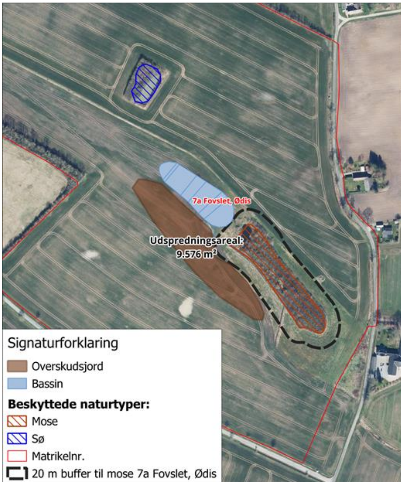
Kortbilag 2: Oversigtskort, der viser minivådområdets placering på matr.nr. 7a Fovslet, Ødis. Overskudsjorden fra anlægsarbejdet spredes ud indenfor det brune polygon. Før udlægning afgraves muldjorden delvist (ca. 15 cm). Jorden lægges herefter ud i max 0,5 m. højde. Polygon med stiplede brune linjer er § 3-beskyttet mose, som der skal tages hensyn til under anlægsarbejdet til.