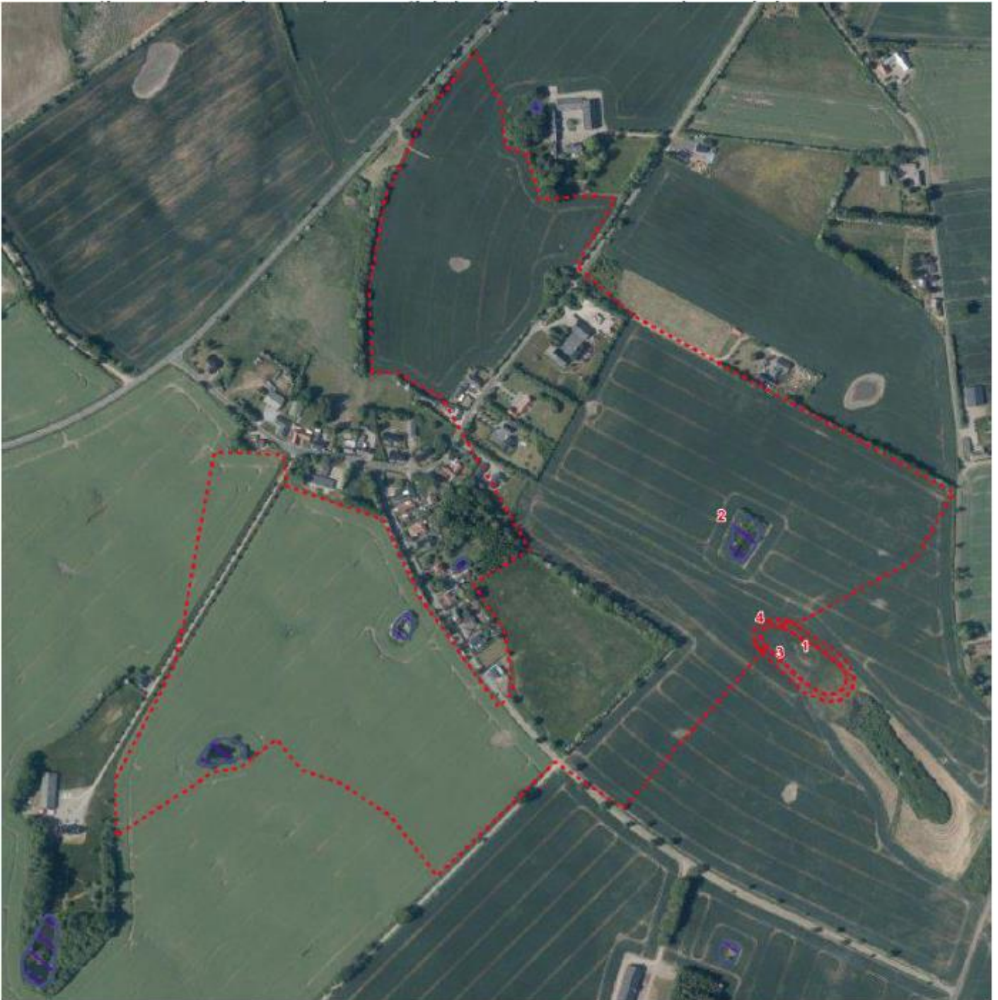
Kortbilag 3: Billede af drænoiland til minivådområdet. Den røde stiplede linje viser oplandets størrelse.