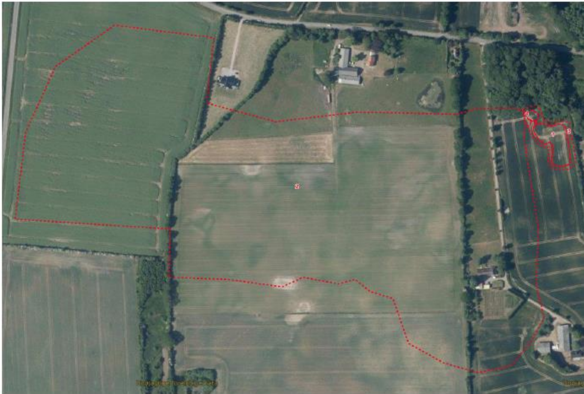
Kortbilag 3: Nr 2 er drænoplanet, nr. 1, 3 og 4 er minivådområdets vandspejl.