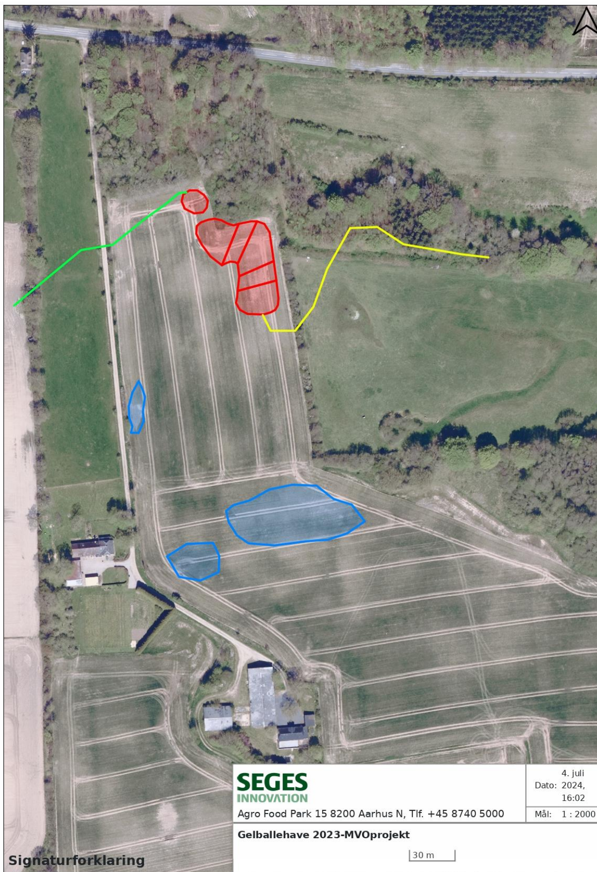
Kortbilag 2: Oversigtskort, der viser minivådområdets placering på matr.nr. 22b Lunderskov By, Skanderup. Overskudsjorden fra anlægsarbejdet spredes ud indenfor den blå polygon. Før udlægning afgraves muldjorden delvist (ca. 15 cm). Jorden lægges herefter ud i max 0,5 m. højde.