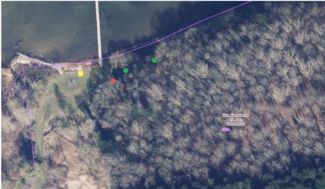
Kort der viser placering af muldtoilet og shelters. Gul firkant er eksisterende bålplads, grønne prikker er nye shelters, og rød prik er nyt muldtoilet.