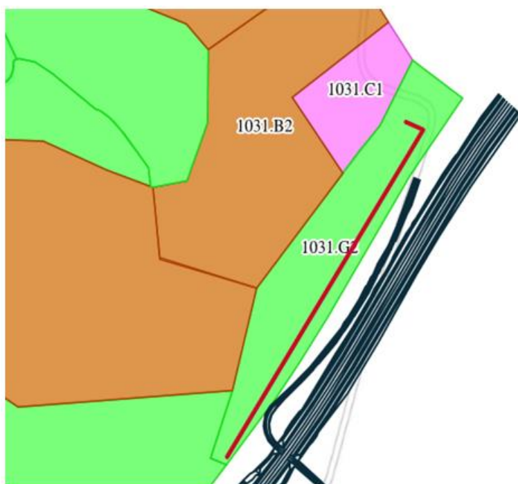
Figur 1: Placering af jordvolden - rød linje - på areal for kommuneplan 1031.G2

Ifølge ansøgningen drejer det sig om max ca. 7.500 m 3 jord. I projektet vil afrømmet jord dog blive indbygget i vejen, hvis det er geoteknisk egnet, så der kan blive tale om en mindre mængde jord til volden. I forbindelse med eventuel kommende byudvikling, kan der blive behov for en større jordvold eller landskabelig bearbejdning på arealet. Der søges derfor nu om en midlertidig jordvold i forbindelse med anlægget af vejen.