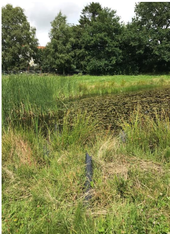
Foto 2 overløbsrør fra sø til vandløb