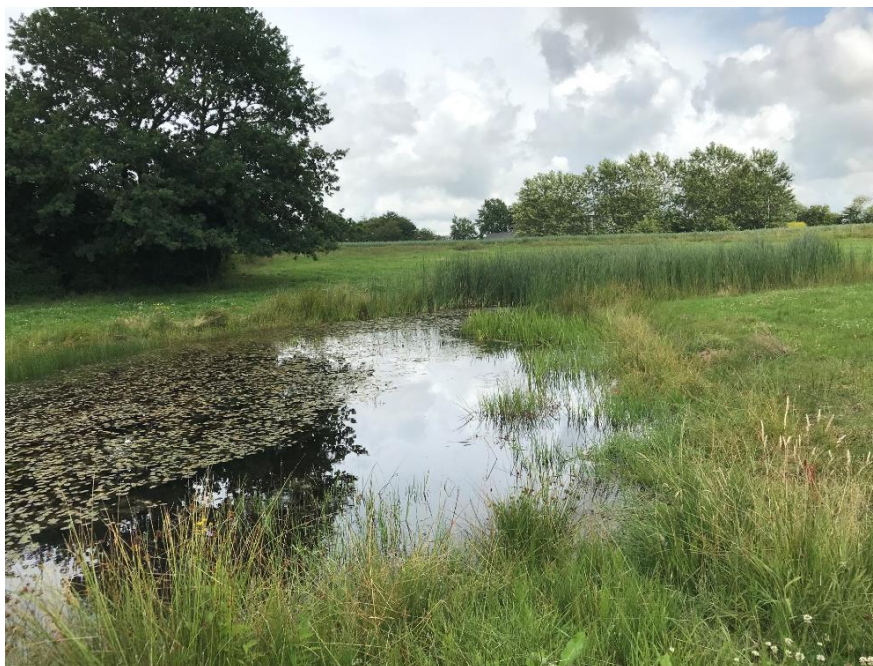
Foto 1, foto taget mod øst med eng th.