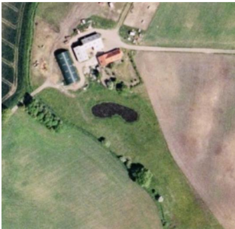
Luffotobilag 2. Luffoto fra 2004, sø er etableret på engen