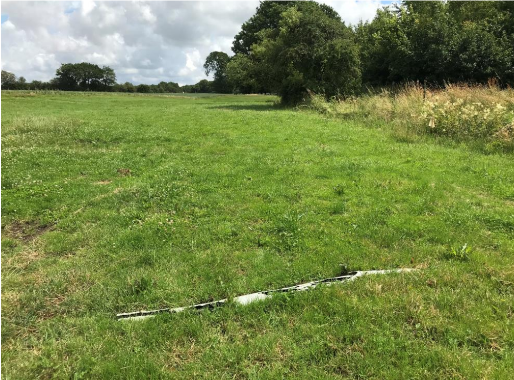
Foto 3 taget mod sydøst af engarealet mellem sø og vandløb, rester af gammelt rør ses i forgrunden