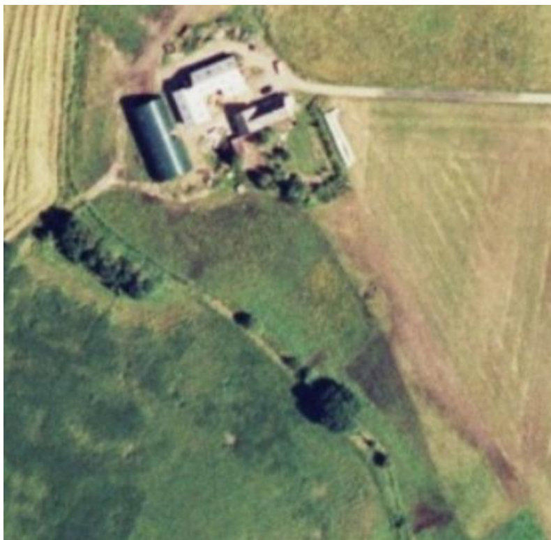
Luffotobilag 1. Luffoto fra 2002