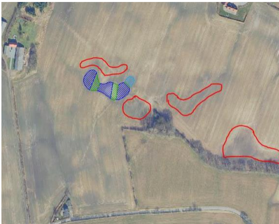
Kortbilag 3. Placering af minivådområde er skraveret med blå og grøn. Overskudsjoeden placeres inden for de røde linjer. Før udlægning afgraves muldjorden delvist (cirka 15 cm). Jorden lægges herefter ud i max 0,5 meters højde.