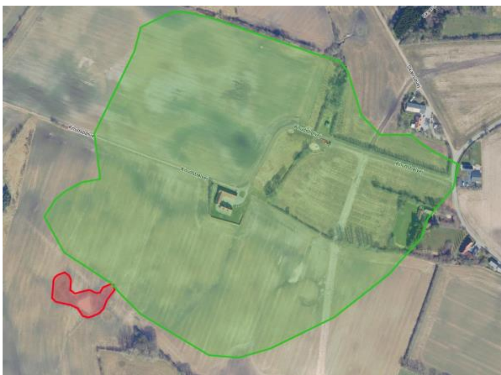
Kortbilag 4. Drænolandet er markeret med grønt, og minivådområdets vandspejl er markeret med rødt.