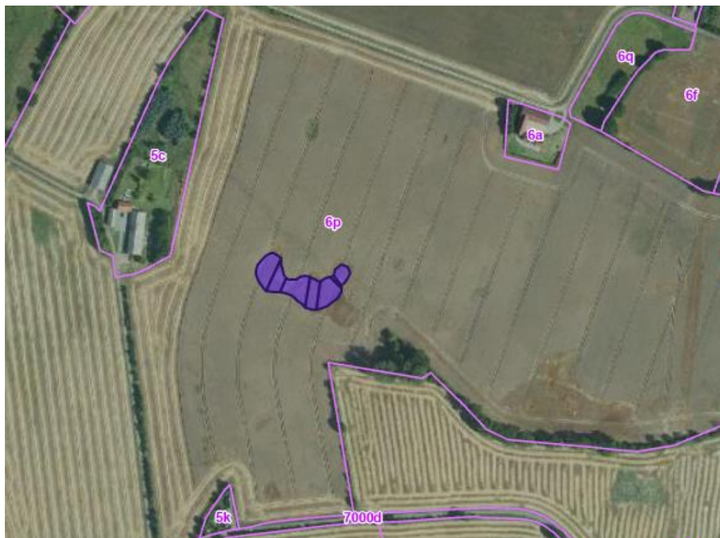
Kortbilag 2. Oversigtskort, der viser minivådområdets placering på matriklen (lilla polygon).