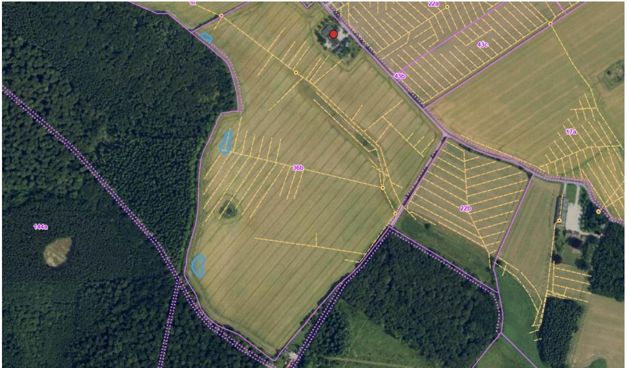
Kortbilag 4. Lufbfoto fra sommer 2022. Af kortet fremgår vandhulleme med blå polygoner, optaget vej med pink, stiplede linjer og markdræn med gule, stiplede linjer.