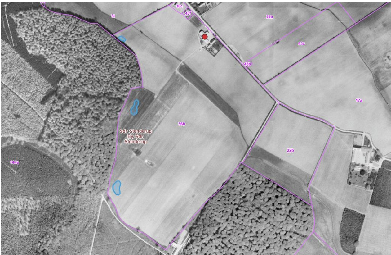
Kortbilag 3. Luftfoto fra 1954. Det ses, at projektområdet (blå polygoner) er opdyrket.