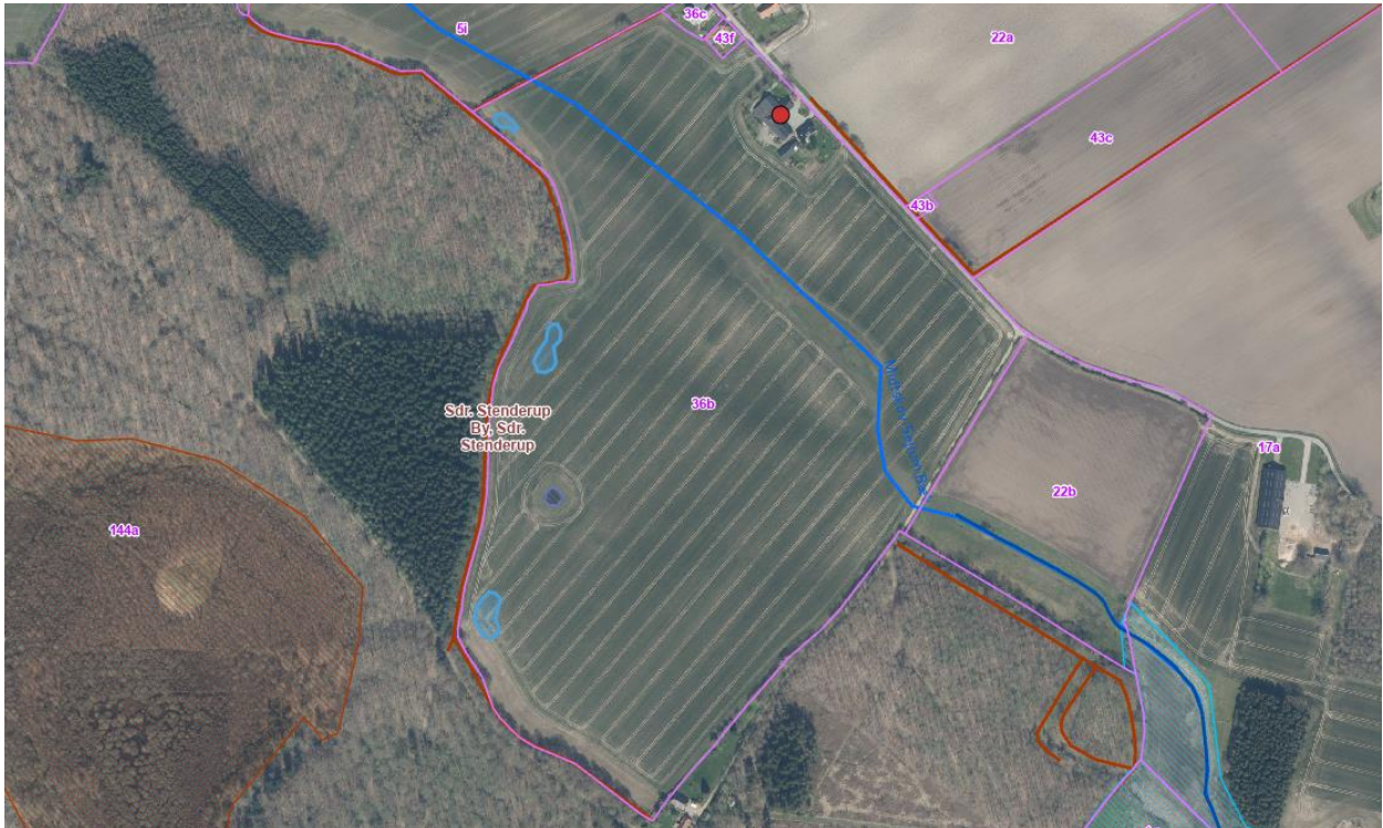
Kortbilag 2. Luftfoto forår 2023. Placering af vandhullerne er markeret med blå polygoner. § 3-natur er skraveret med rød (mose), blå (vandhul) og grøn (eng), den rørlagte Midtskov-Sejlund Bæk er markeret med blå streg, og beskyttede sten- og jorddiger er markeret med rød streg.