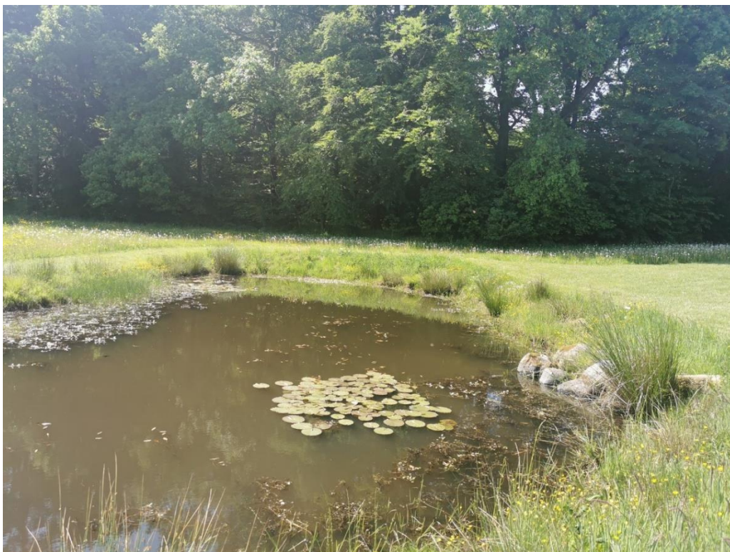
Billedbilag 2. Vandhullet fra sydøst.