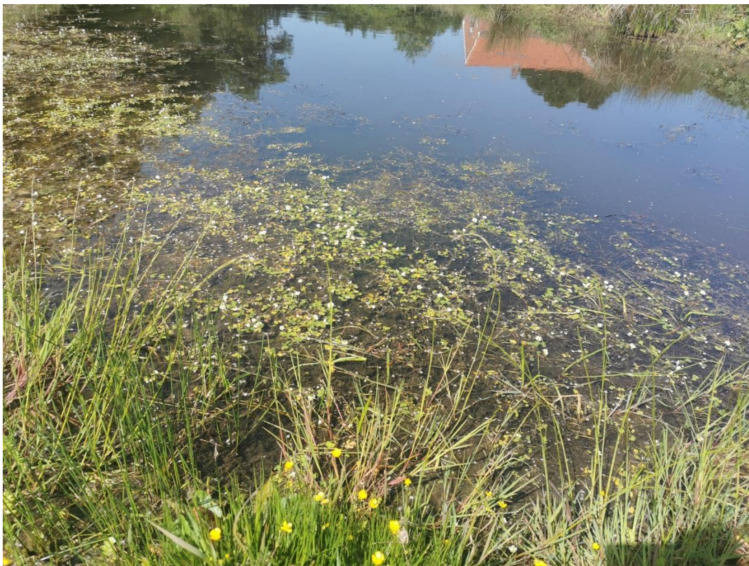
Billedbilag 4. Vandranunkel og trådalger.