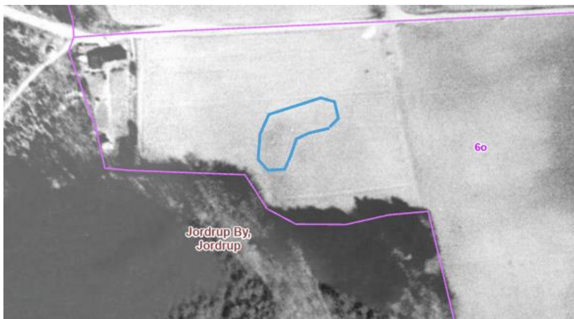
Kortbilag 3. Luffoto fra 1954. Arealet, hvor vandhullet er etableret, er markeret med blå polygon. Det ses, at området er opdyrket.