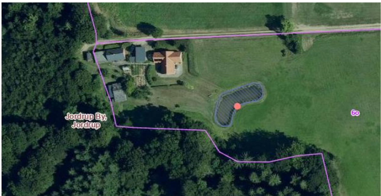
Kortbilag 2. Luftfoto fra 2022. Placering af vandhullet på matriklen er skraveret med blå. Registrering af løvfø er markeret med rød prik.