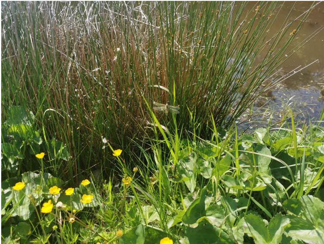
Billedbilag 3. Eng-kabbeleje, blå libel (hun), lyse-siv, lav ranunkel m.v.