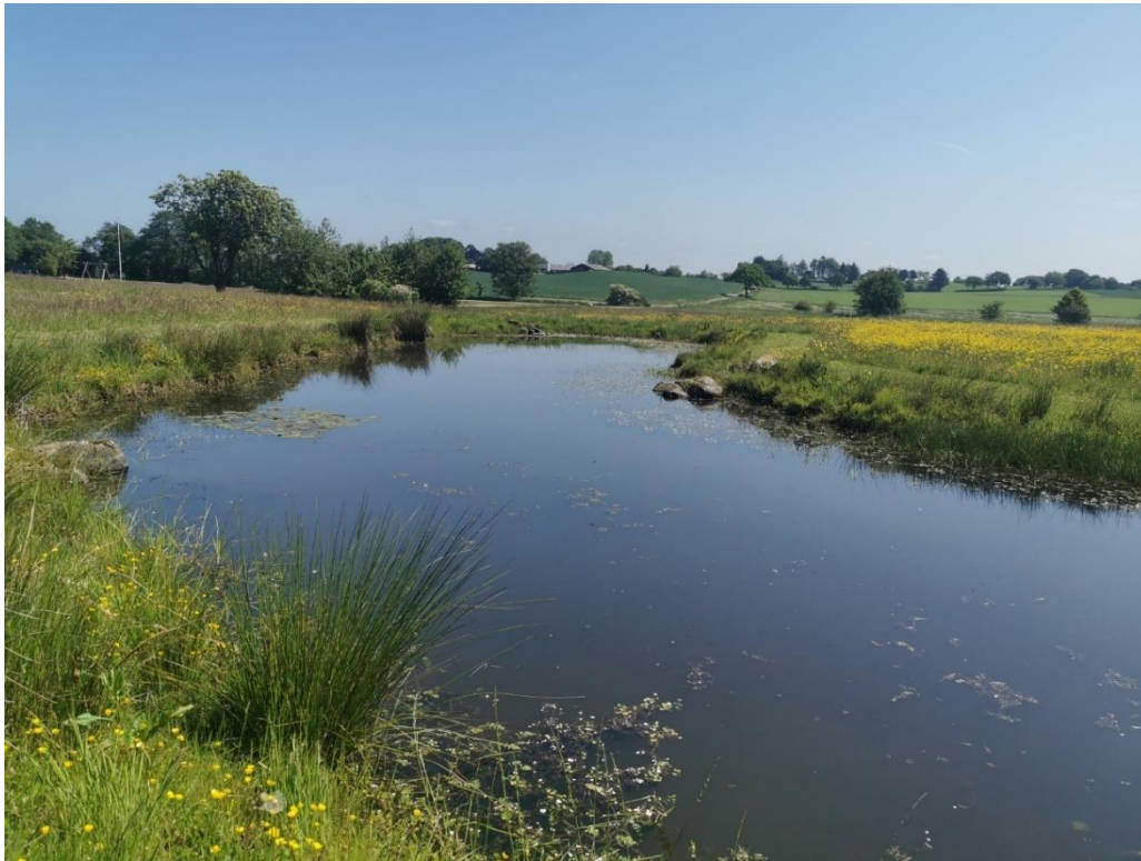
Billedbilag 1. Vandhullet set fra nordøst.