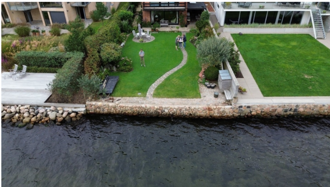
Figur 1. Eksisterende betonmur med indstøbte natursten ud for Fjordvej 106B, 6000 Kolding.

Der søges om tilladelse til en stenkastning ud for den eksisterende betonmur, dels for at sikre fast ejendom og dels for at sikre infrastruktur i form af en afløbsledning, som er placeret i arealet bag betonmuren. Ansøger oplyser, at hvis der ikke udføres supplerende sikring, vil der kunne forudses yderligere erosion, som muren ikke er designet til, hvorved der vil opstå kollaps pga. den tiltagende hældning af betonmuren mod fjorden.