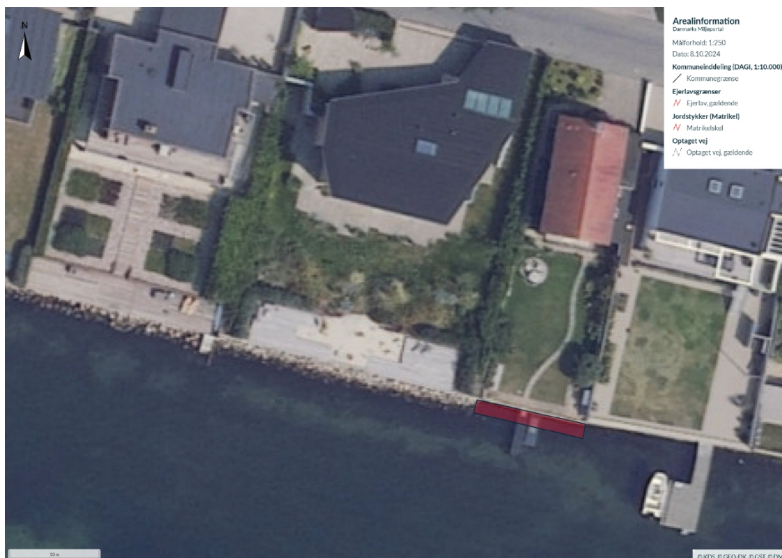
Figur 2. Oversigtskort, hvor anlæggets udbredelse er indtegnet med rødt.

Stenkastningen opbygges af geotekstil, hvorpå der er placeret skærver og ral i 0,06-0,15 m diameter, som vil danne bund for det øvre lag dæksten bestående af natursten i størrelse 300- 600 mm diameter. Princip for opbygning fremgår af figur 3.