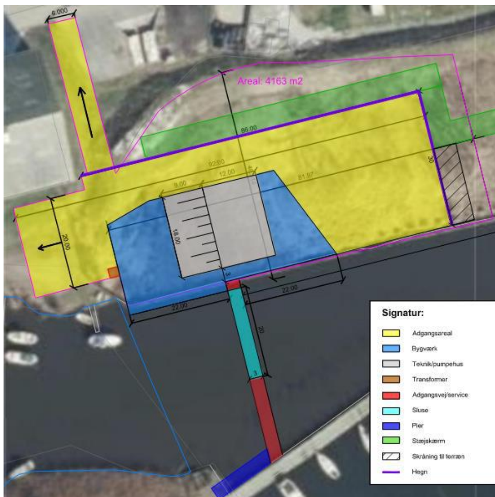
Figur 2. Placering af pumpebygværk og sluseport.

Sluseporten (inklusive pier) anlægges ved den eksisterende bådebro på sydsiden af Kolding Å. Pumpebygværket placeres på nordsiden af Kolding Å på Kolding Havns arealer. Bygværket placeres i det sydvestlige hjørne af det nuværende indspulingsbassin.