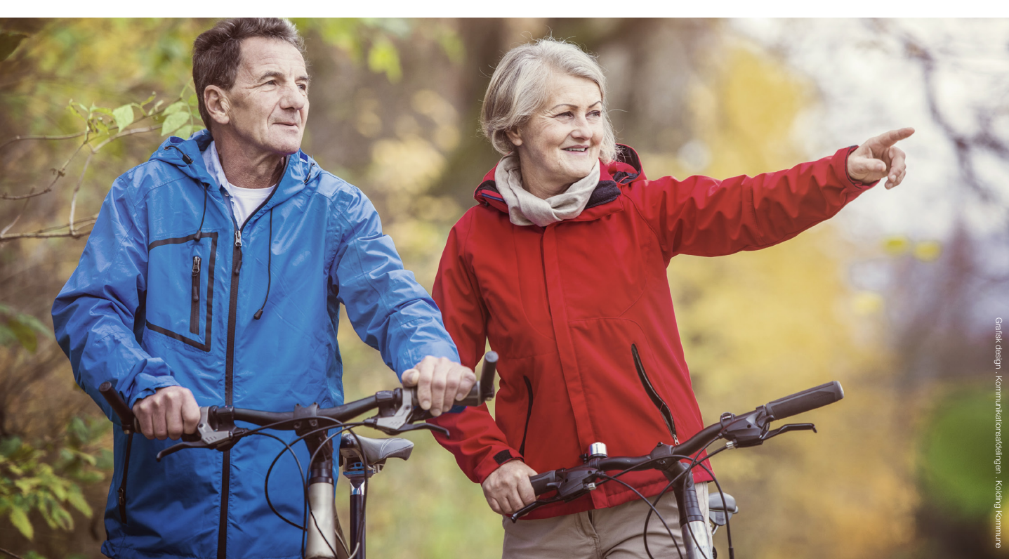
Gratis design - Kommunikatørselskabet, Kolding Kommune